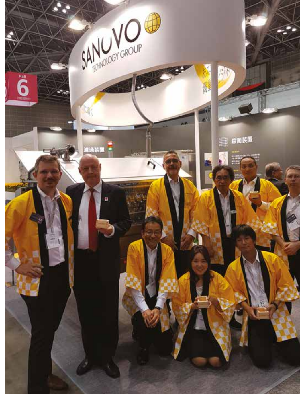
Team photo of our staff at the FOOMA exhibition in June 2017 were the Danish Ambassador in Japan paid us a visit.